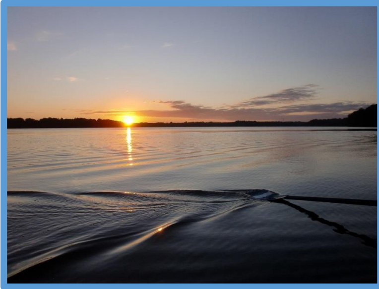
Solopgang over Sorø sø.